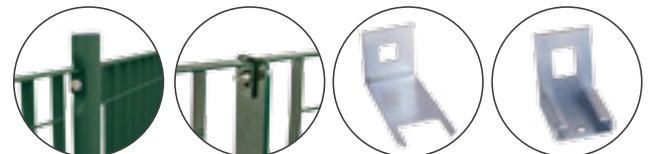
Piantana in tubo ricalcato Ø 50 mm

Dimensioni piastra 130x60x7 mm con 2 fori Ø 12 mm fino H 1986 mm, 4 fori H 2118 e 2514 mm