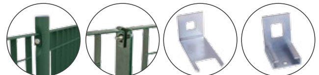
Piantana in tubo ricalcato Ø 50 mm