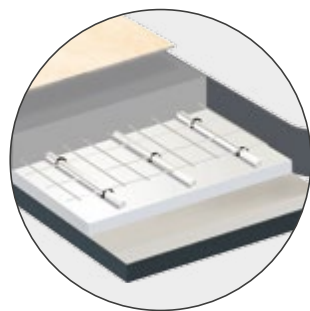
Per pavimenti riscaldati