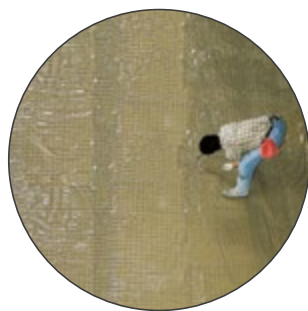
Esempio di posa