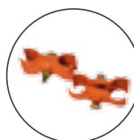
Giunti di sicurezza