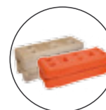
Blocchi in CLS e ABS, Ø foro 38 mm